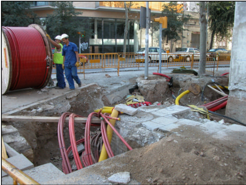
Foto 1: Rebaix efectuat a la cantonada del carrer Nàpols amb el carrer Almogàvers.